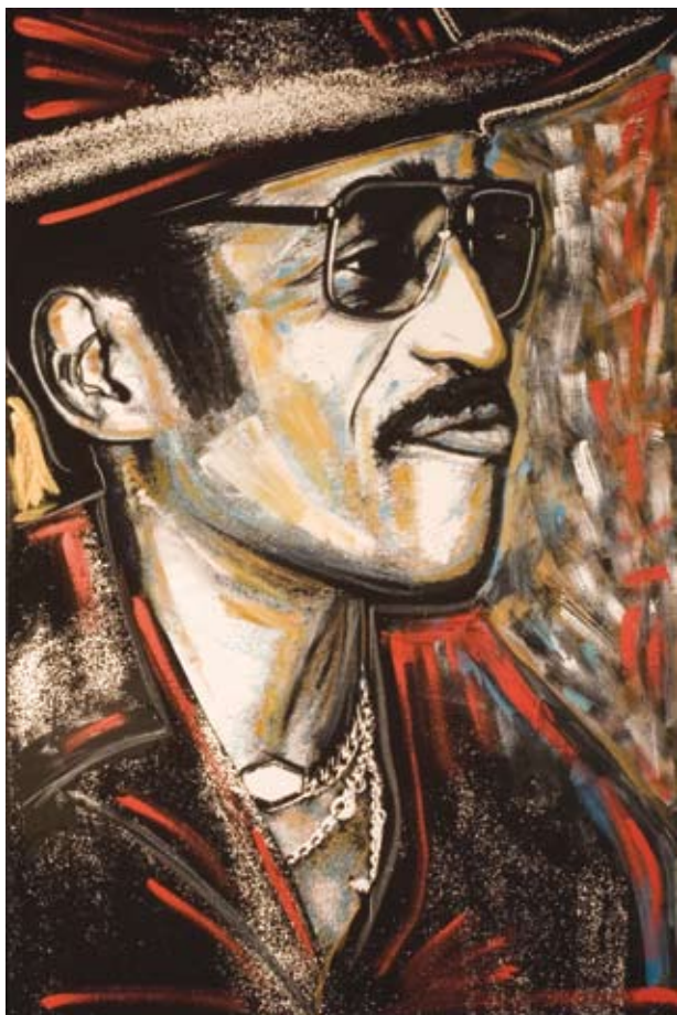
Sammy Davis Junior